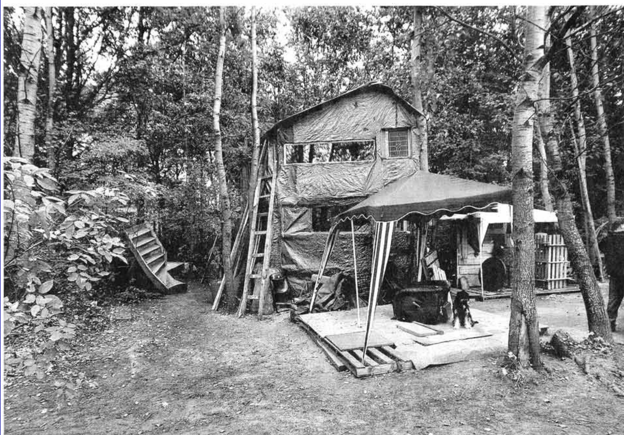
Boomhuis van een Canadese stadsnomade, aan de rand van Amsterdam.