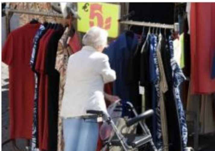
Er wordt gesnoeid in de AWBZ. Onder andere ouderenbegeleiding verdwijnt. (ANP)

ANP op 03 juli '08, 13:09, bijgewerkt 03 juli '08, 13:57